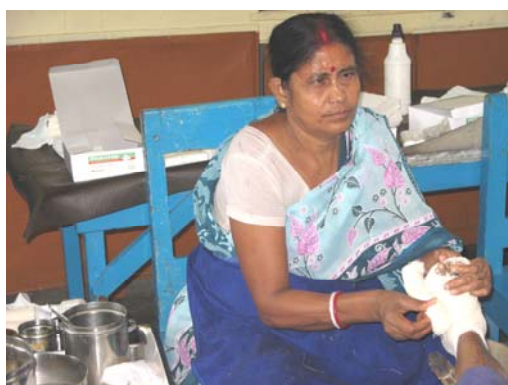
Výměna obvazů na ošetrovně