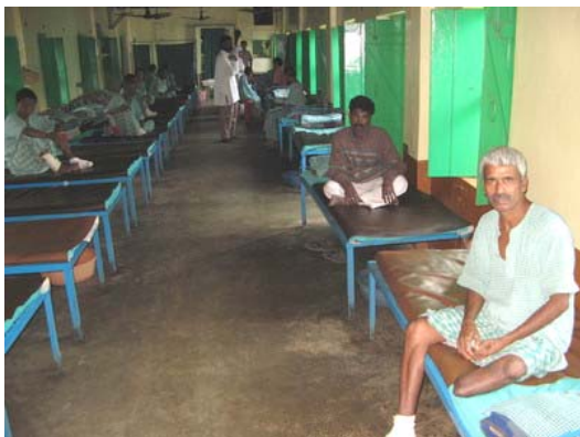
Nemocniční pokoj s malomocnými