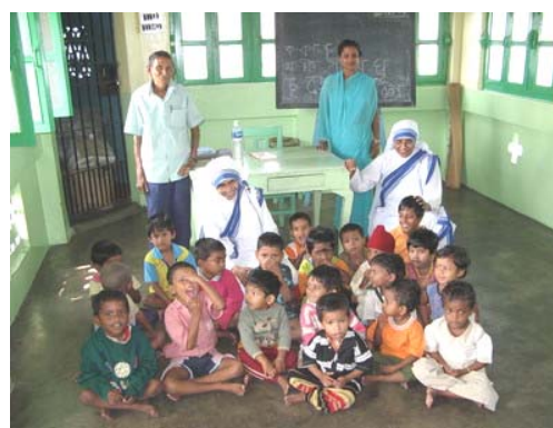
Škola pro děti malomocných pacientů

„Malomocní se mohou zdát znetvoření,“ tvrdila vždycky matka Tereza, „ale stejně jako ostatní potřební jsou to obdivuhodní lidé, schopní velké lásky .“