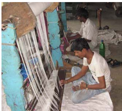
Vyléčení malomocní při práci na tkalcovských stavech

Nebylo to na bezprostředním počátku její mise, ale teprve až získala určité zkušenosti.