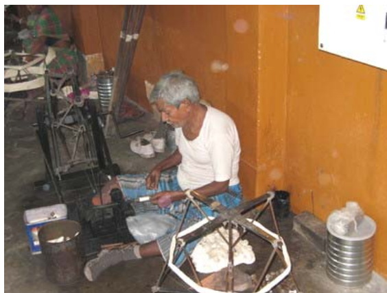
Každý se snaží zapojit do práce podle svých možností

Důvod, proč si matka Tereza svou bavlněnou tašku tolik střeží, je opravdu citový. Vyrobyly ji totiž její nejmilejší děti: malomocní. Látku na ni s nekonečnými obtížemi utkaly zmrzačené ruce některých z tisíců osob postižených touto hroznou nemocí, o které matka Tereza pečuje v řadě svých nemocnic pro malomocné. Látku pak nastříhali a sešili další lidé, také postižení leprou, kteří díky matce Tereze našli uspokojivé zaměstnání, které jim umožňuje důstojně si vydělávat na živobytí.