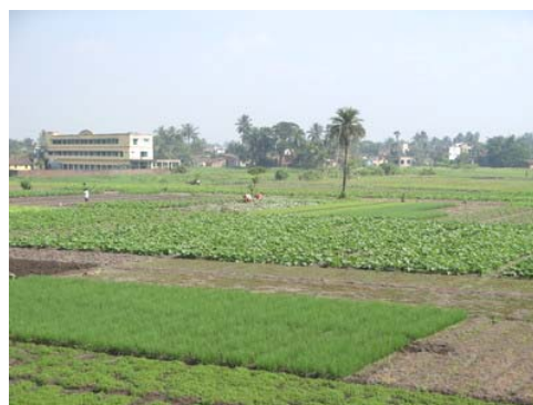
Políčka pro pěstování zeleniny

S malomocnými žijí ve vesnici také zdraví lidé , z velké části spolupracovníci, kteří svou přítomností a normálním chováním k nemocným předcházejí jakékoli jejich vylučování za okraj společnosti a vracejí tak nemocným důstojnost lidských bytostí, na niž nemocní mají právo.