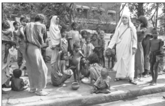
Matka Tereza s nejchudšími z chudých

„Je dobré dát hladovějícímu chléb, ale ještě lépe je zajistit, aby již nemusel hladovět.“ Nicméně poznala, kde je její místo a co je její poslání. K tomu, aby se odstranily příčiny nelidských podmínek života těch nejchudších ve slumech, bylo zapotřebí velkých a rozsáhlých změn v nespravedlivém uspořádání společnosti. A k těmto změnám