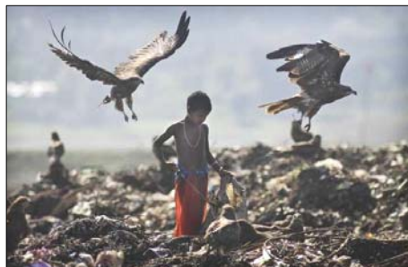
Děti hledají na haldách odpadků, co by se dalo ještě použít nebo zpeněžit

Keňa: Většina z nás asi ráda vzpomíná na dětství. Mnoho dětí ze slumů v Nairobi (Keňa) však nikdy na dětství vzpomínat nebude. Těch let, ve kterých se rádi vracíváme k dětství, se totiž nedožijí. Nikdo se o ně nezajímá, nikdo na ně nemá čas. Jejich rodiče, kteří stěží užíví rodinu, nemají prostředky na to, aby jejich děti mohly chodit do školy. A tak se děti obracejí k ulici, která jim nabízí volnost a povyražení. Stávají se součástí part, které žijí na smetišti a vydělávají si tříděním odpadu . Večer dostanou za svou práci peníze, které okamžitě utratí za jídlo a drogy. Mezi drogami je oblíbené především lepidlo. To je mnohem levnější než chleba a poskytuje tak snadnou možnost, jak zapomenout na bezvýchodnou situaci a trochu si zpříjemnit těžký život. Následky čichání se však brzo dostávají nejčastěji v podobě těžkého poškození mozku. Proto mají -náctiletí obyvatelé ulice často tupý výraz a vratký krok a končí jako nemohoucí lidské trosky. 1